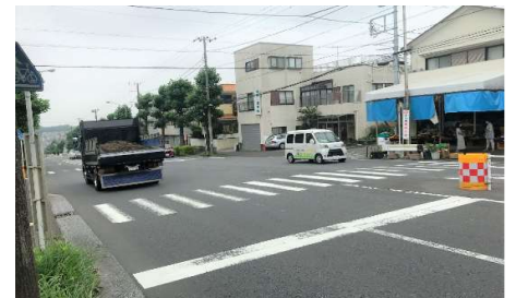
信号機のない横断歩道(森青果店付近)

隣接する信号機との距離が原則として150メートル以上離れていること。ただし、信号灯器を誤認するおそれなく、交通の円滑に支障を及ぼさないと認められる場合は、この限りではない。