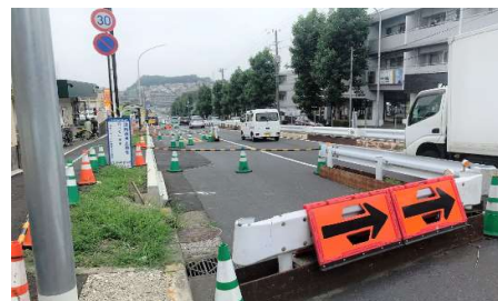
現在実施されている小山台地区4車線化工事