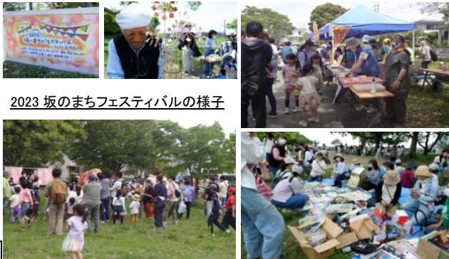
2023 坂のまちフェスティバルの様子