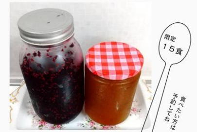
梅の実ジャムor桑の実ジャムいずれかを使います

ジャムを使ったきまぐれおやつ ¥220/ ケーキセット¥450 ジャムを使った1品を含む小皿ランチ 大人¥880/子ども¥500 未就学児¥330