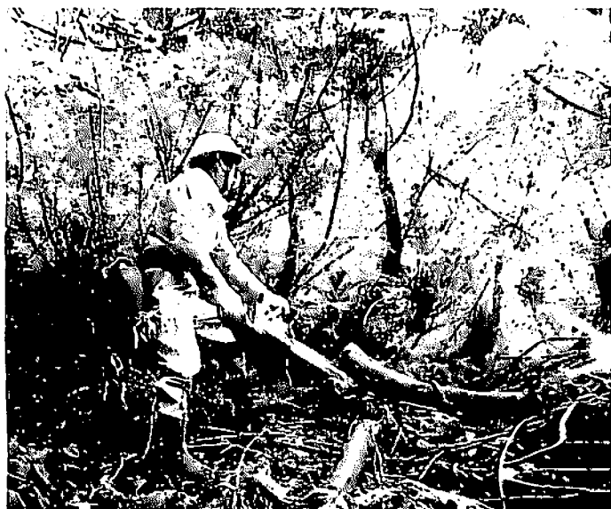
間伐作業を行う森林組合作業員

3つの森林組合が統合に向けて話し合った経緯はあると認識しています。各森林組合の経営状況、特に財務内容の相違が統合の進まない要因です。 設業などの雇用創出につなげる取り組みを進めていきます。森林組合が引き続きその役割を十分果たしていくためには経営基盤の強化が重要であり、その方策として統合が必要であると考えます。