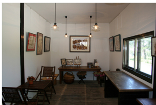
高原にあるみんなのいえ