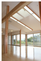
「まち」とともに 「ふつう」に暮らす