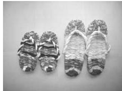
長野さざんかの会とアトリエ虹で行なわれている活動の様子、作品の一部です。