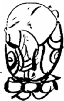
作品: さとうともに